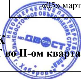
ГРАФИК проверок членов НП СРО ДВОСТ во II-ом квартале 2013г.